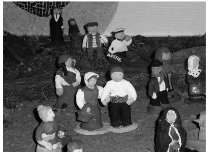
Lustiges Völkchen am Brunnen

„Les santons“ bezeichnet eine provenzalische Krippe mit Tonfiguren, die in der Provence von einem eigenen Berufsstand, den „santoniers“ hergestellt werden. Diese Tradition stammt aus dem 18. Jahrhundert und es werden Figuren wie zum Beispiel Fischer, Bauern oder Olivenverkäufer dargestellt, oft auch einfach alle möglichen Bewohner einer kleinen Stadt.